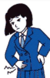
生 理 痛