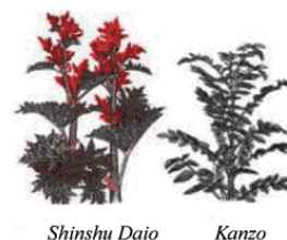
Shinshu Daio Kanzo